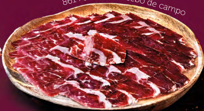
8614 Jamón de cebo de campo