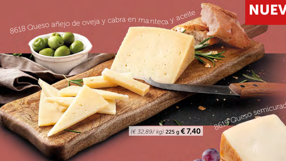
8618 Queso añejo de oveja y cabra en manteca y aceite