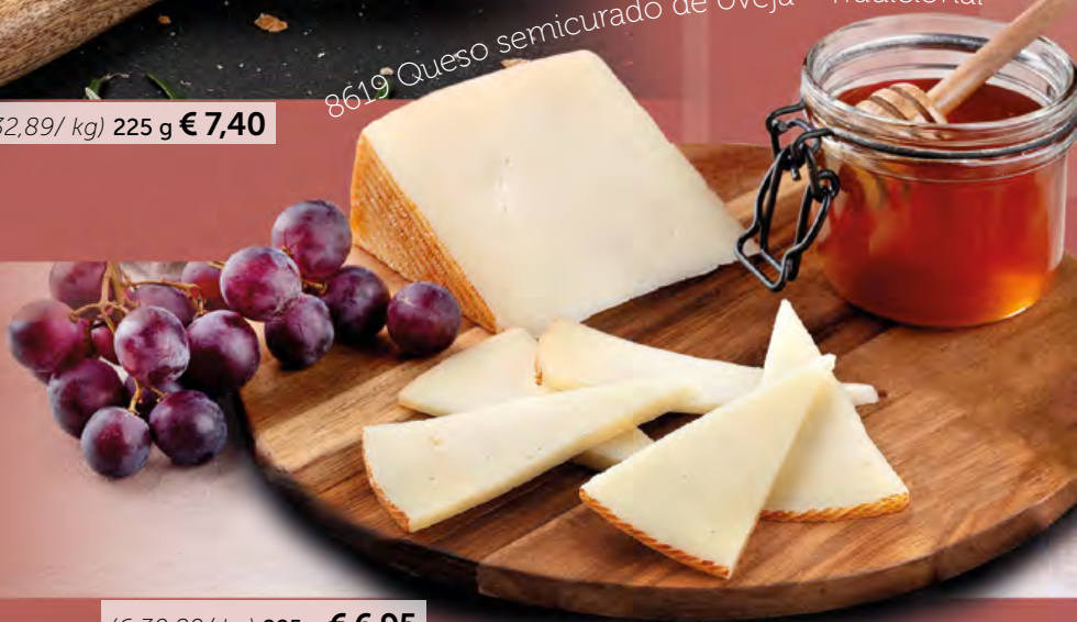
8619 Queso semicurado de oveja - Tradicional