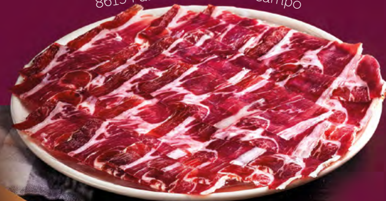
8615 Paleta de cebo de campo

Y la tradición con nuestro queso 100% oveja con un sabor auténtico y tradicional, con una maduración óptima para satisfacer tus deseos más queseros.