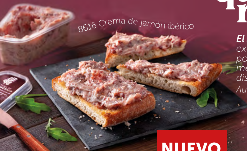
8616 Crema de jamón ibérico