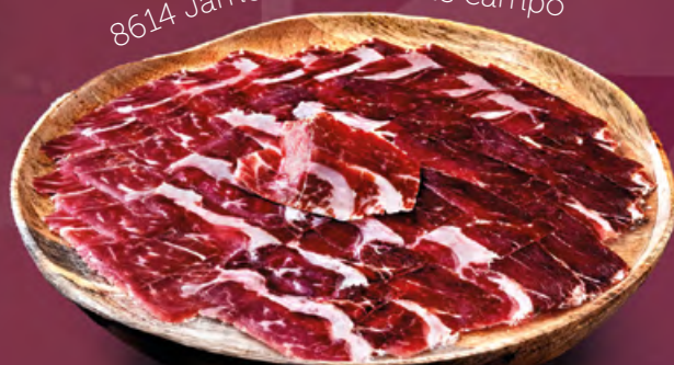
8614 Jamón de cebo de campo