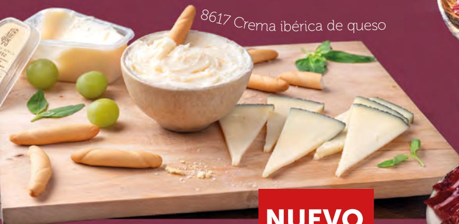
8617 Crema ibérica de queso

Autenticidad, raíces y origen al estilo artesano