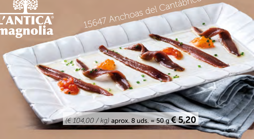
15647 Anchoas del Cantábrico en AO

(€ 104,00 / kg) aprox. 8 uds. = 50 g € 5,20