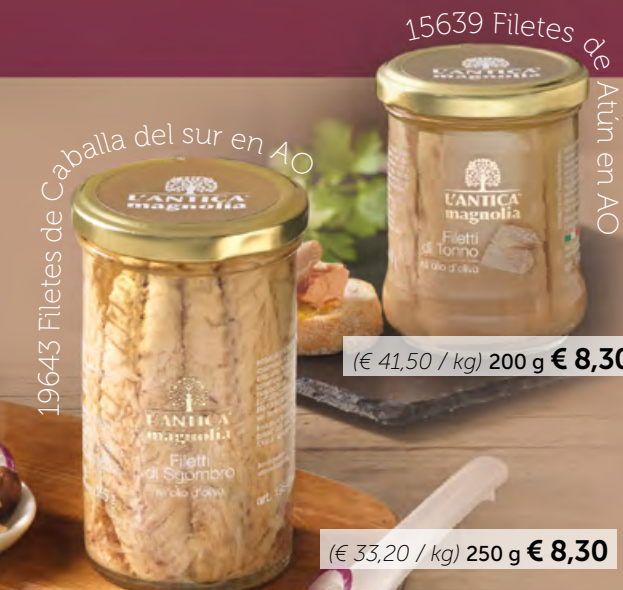
19643 Filetes de Caballa del sur en AO